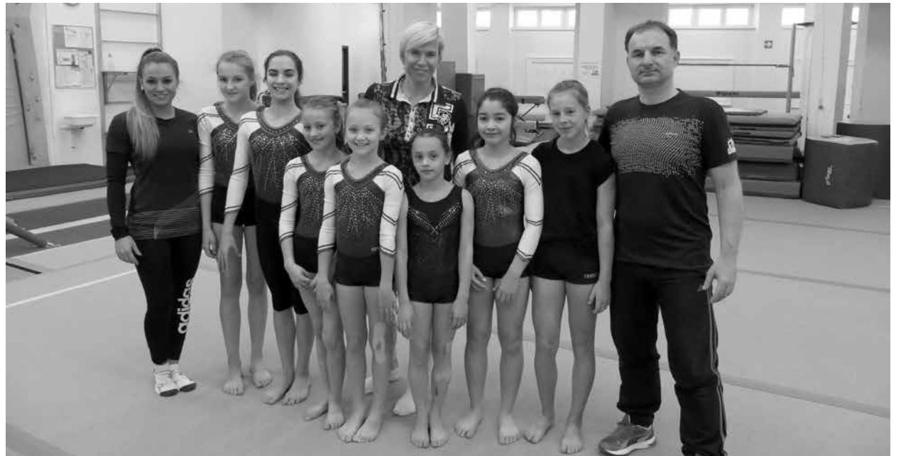
Budějovické gymnastky přijela navštívit a podpořit Kateřina Neumannová.

text: Zuzana Pučejdlová